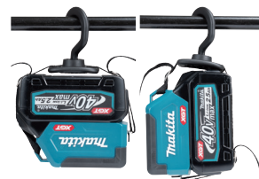
Alça com gancho (acessório opcional)

A alça com gancho é presa aos dois orifícios na lanterna, de modo que pode ser usada em posição invertida.