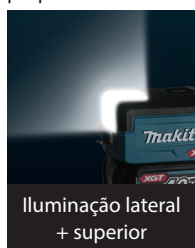
Iluminação lateral + superior

Equipado com 2 LEDs: um para iluminação lateral e outro para iluminação superior, que juntos proporcionam uma iluminação angular ampla.